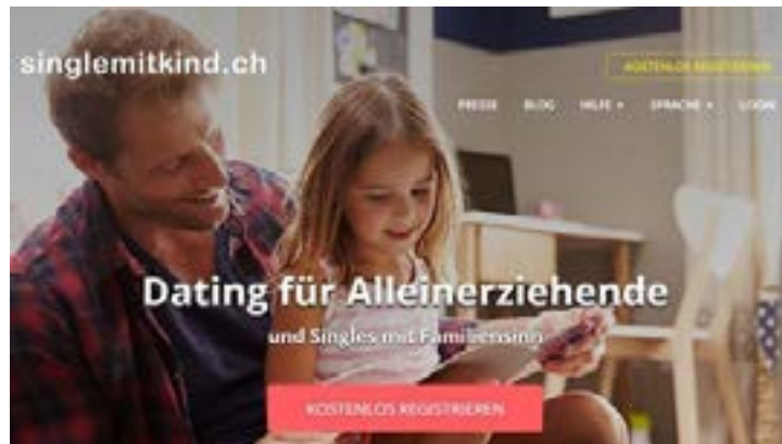
SingleMitKind.ch: Singlebörse für Alleinerziehende.

Im Bestreben meiner Freundin zum neuen Männerglück zu helfen, recherchierte ich kurz und stellte fest, dass ein Angebot wie Singlemitkind.ch dem Markt fehlt, trotz der hohen Scheidungsrate in der Schweiz. Nach ein paar Gesprächen im Bekannten- und Freundeskreis war mir schnell klar, dass eine Dating-Plattform für Single-Eltern ein absolutes Bedürfnis ist. Und so machte ich mich auf die Suche nach Partnern, mit denen ich dieses Vorhaben umsetzen könnte.